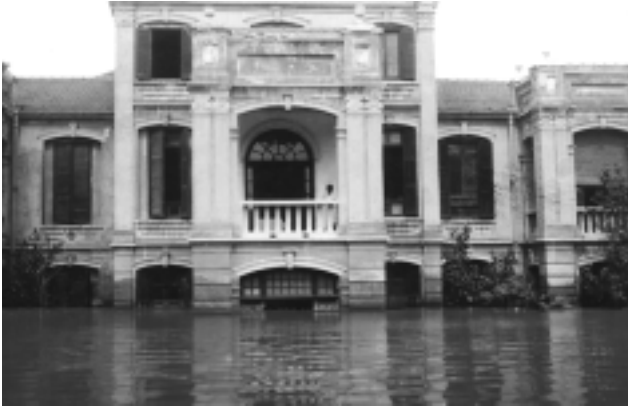
El río Yangtsé anegó la casa Columbana en Hanyang en las inundaciones del año 1931.

De 1921 a 1950, China estuvo siempre en un caos. En los años 20, el Ejército Nacionalista Chino peleó en contra de los comunistas. Los dominadores de la guerra, muchos de ellos bandoleros viciosos, peleaban en contra de cualquiera que se pusiera en su paso. Si se añade a esto a los bandidos independientes que no peleaban por ninguna otra causa que la propia y que con frecuencia buscaban dificultades sólo por buscarlas, la situación no podía ser peor. Cogían a personas para demandar dinero y saqueaban ciudades a no ser que pagaran para que no lo